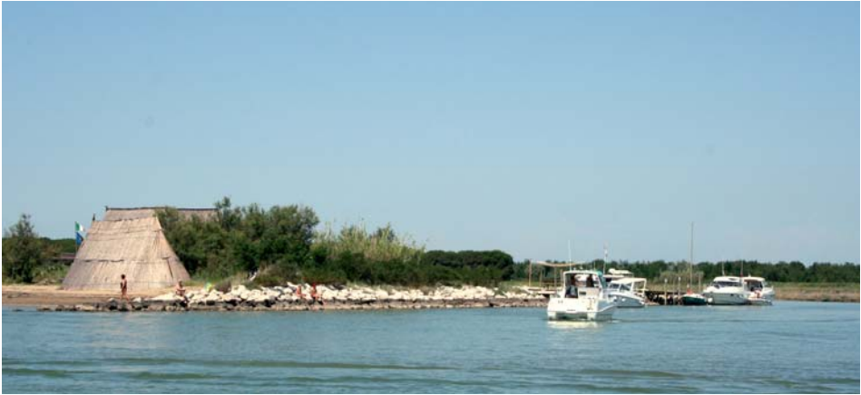
Schilfhütten der Fischer sind heute Wochenendbehausungen.