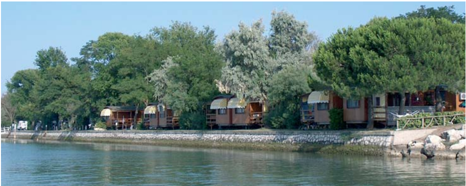
Der Campingplatz Capa Longa mit seinen festen Appartements.

Camping Capalonga, Viale della Laguna 16, I-30020 Bibione Pineda (VE), Tel.: 0431 438351, Fax 0431 438986, im Winter erreichbar Tel.: 0431 447190.