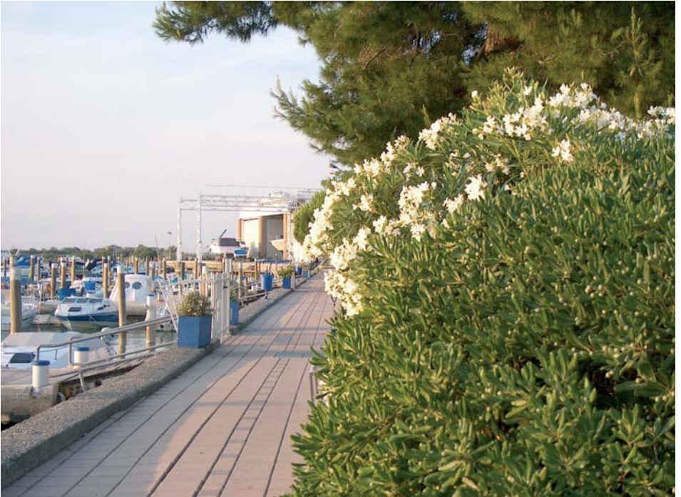
Die Anlage bietet Parkplätze hinter dem Buschwerk, dicht an den Stegen.