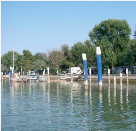
Der Anleger des Campingplatzes.