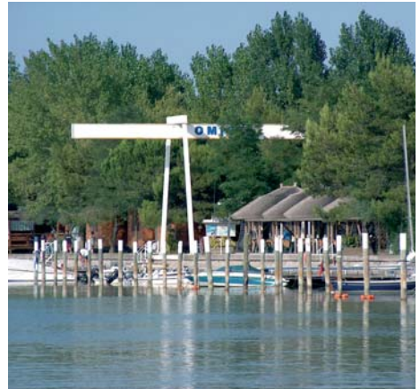
Der Kran gehört zum Campingplatz. Nur sehr kleine Boote können am Lagunenstrand geslipt werden.